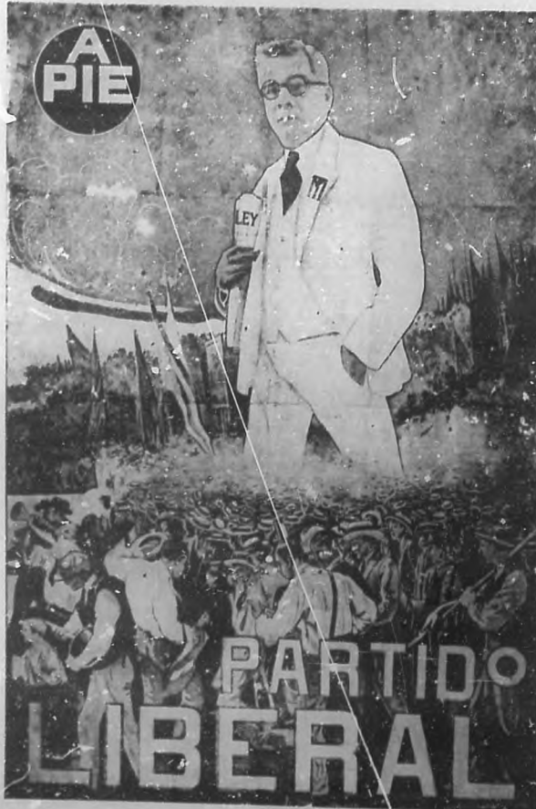
¡A pie!, en las contiendas cívicas y pacíficas de la era republicana.

"¡A caballo!" significaba una política violenta y exclusivista que no respetaba las leyes fundamentales de la nación, que hacía escarnio de los derechos del pueblo y amparaba en mayores iniquidades, siempre que resultaran productivas para los mangoneadores de la situación.