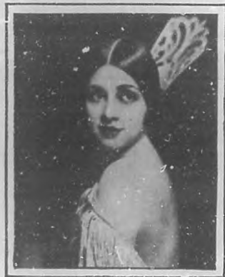
ETHELIND TERRY, famosa actriz que actúa en los mejores teatros del Broadway, New York.