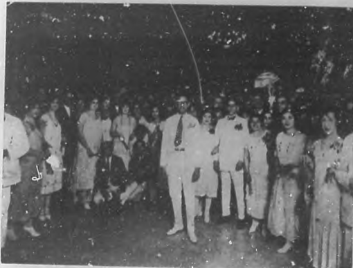
LUCIDA FIESTA. —Un aspecto de la numerosa concurrencia, que asistió al Baile de las Flores, celebrado en los salones del Centro Gallego.

Nuestro muy estimado amigo y admirado colaborador el doctor Cabello, que acaba de ser nombrado Notario Público con residen-