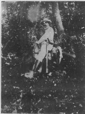
¡A caballo!... en las luchas cruentas por la independencia y las libertades patrias.

"A caballo" en la guerra y "a pie" en la paz, el general Machado es encarnación de los ideales y anhelos de nuestro pueblo y por eso el pueblo le dió el triunfo en los pasados comicios y le espera un Gobierno justo, recto y beneficioso.