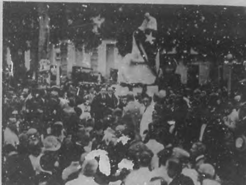
LOS COLABORADORES DEL DR. FINLAY. —Aspecto del público que asistió a la inauguración de los bustos de los colaboradores del Dr. Finlay, en el parque que lleva el nombre de ese ilustre sabio cubano.