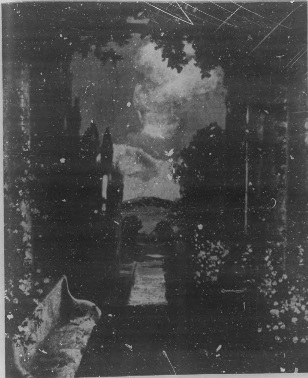
JARDIN DE ENSUEÑO

He aquí, pues, por qué hay en el patriotismo una alegría santa y honda, y callada, frente a la ceremonia de la toma de posesión del nuevo Presidente, el día de la fiesta de la Patria. ¡Porque un