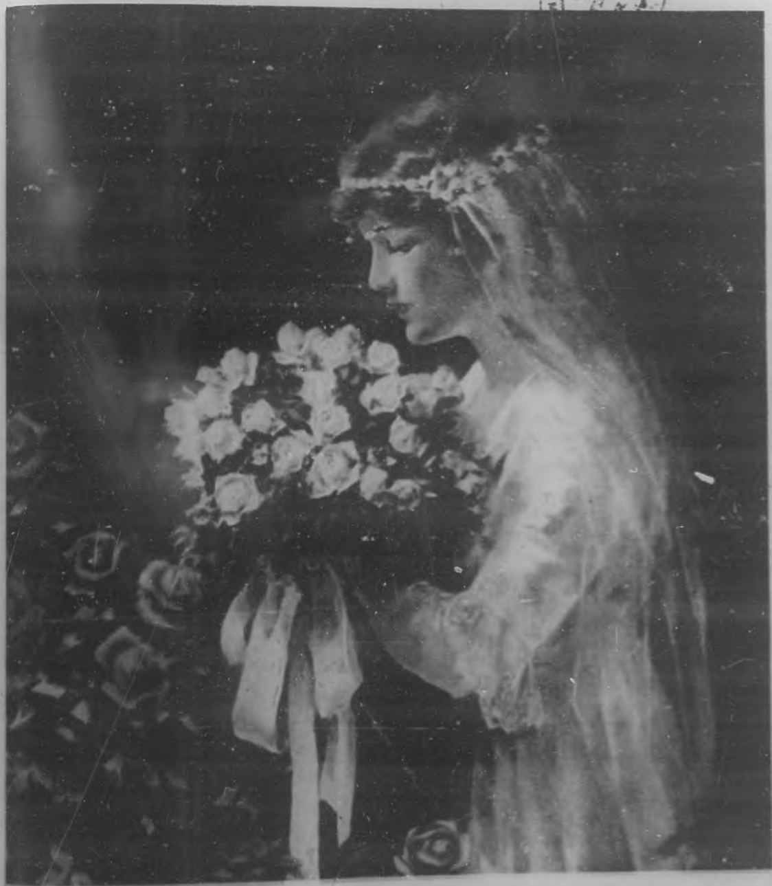
CON FLORES A MARIA