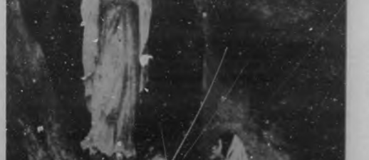
Preciosa imagen de la Virgen de Lourdes. "LA VENECIA", de O'Reilly 54, ha recibido nueva colección de imágenes en hermosos lienzos.

REDONDO Y HERMANO Compra-Venta, Alquiler y Reparación de máquinas de escribir y sumar. Inspección a domicilio. Nos trasladamos al interior para inspección mensual de su máquina. Envíenos su máquina para reparar. Nosotros pagamos el flete. Talleres y Aviso: Al teléfono M-9600. Luz Núm. 17.—Habana. Ambrós 15 y 17.—Regla.