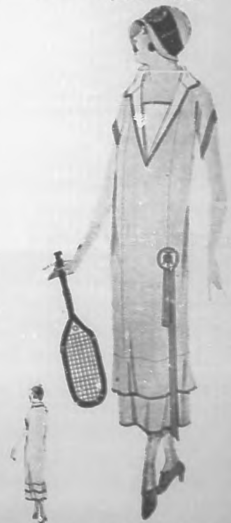
Traje sport. Material de waranhol de hilo con vivos de color. Caida de cinta del mismo tono del adorno.