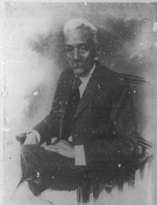
SR. GERARDO MACHADO

Por todo eso es que nuestra alma se estremece de júbilo. Por que concebimos y presentimos todo la riqueza de patriotismo que albergan los pechos de los que tomarán el timón de la casi desarrollada nave cubana el Veinte de Mayo de 1925, es que situándonos en lo más elevado de la República gritamos como triunfo y como insulto contra las jettaturas de los traidores; ¡Viva Cuba Libre!