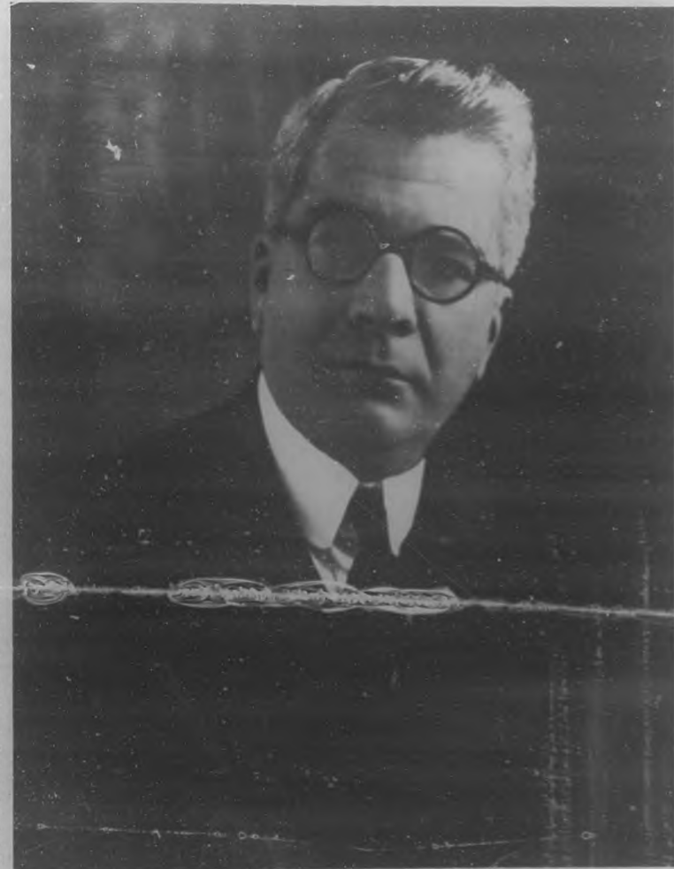
GENERAL GERARDO MACHADO Y MORALES Presidente electo de la República por el Partido Liberal y en cuya gestión como Primer Magistrado de la Nación tiene cifradas hondísimas esperanzas el patriotismo cubano.

Pero en Cuba, y en aquella época, no había acción ciudadana. Los ciudadanos que existían no eran ya bastante fuertes ni bastante numerosos para vencer a la fuerza que venía levantándose, ante ellos, ante el ideal de la República. Fuerza, poder misterio-