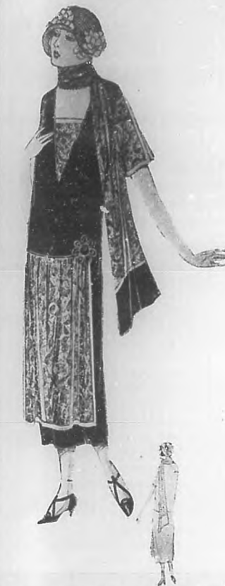
Encantador modelo de tarde, confeccionado en crepé y zoides de encaje de seda. La bufanda de los mismos materiales.

Las elegantes en los "parties", lucen bien (Pasa a la Pág. 21.)